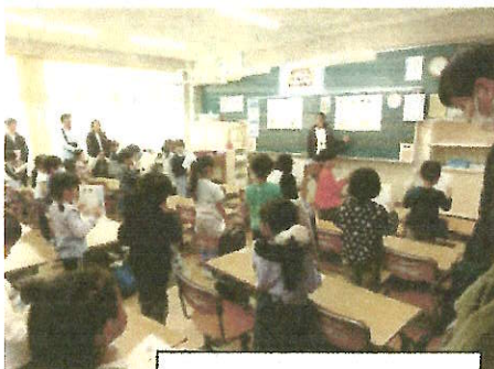
1年生の授業の様子

今年度も、保護者と学校・地域が手を取り合って、子ども達の健やかな成長を支えていきたいと考えていますので、今後ともご支援ご協力をお願いします。