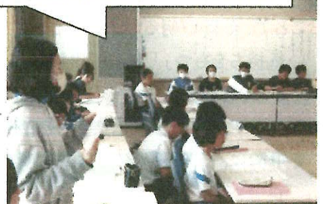
活発に意見を出し合う 代表委員会