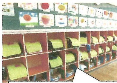
整った1年教室のランドセル