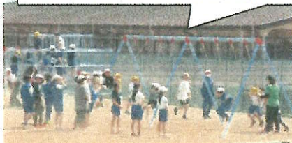
昼休みは みんな元気に外遊び